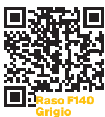
Raso F140 Grigio

Rasatura premiscelata, a “grana media” e a “grana grossa”, per interni ed esterni.