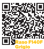
Raso F140F Grigio

Scansiona i QR code per maggiori informazioni